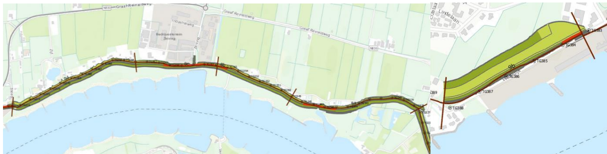
Figuur 1: dijkvak 8 en 9

De trillingsberekeningen zijn uitgevoerd voor dijkvakken 8 en 9. Op deze dijkvakken worden de drie mogelijke oplossingen – grond binnenwaarts, grond buitenwaarts en langsconstructie – toegepast. Omdat er langs deze dijkvakken relatief veel woningen staan en vanwege de nadere uitwerking van het Definitief Ontwerp kunnen deze dijkvakken qua werkzaamheden als representatief worden beschouwd voor het gehele project. De dijkvakken 8 en 9 zijn weergegeven in figuur 1.