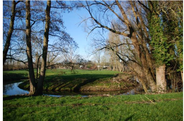
Graaf Reinald Alliantie

In 2015 heeft op het terrein een grondradar onderzoek plaatsgevonden. Hierbij zouden mogelijke funderingsresten zijn vastgesteld (bijlage bij het bestemmingsplan Kern Tuil, herziening Haarstraat 8 (NL.IMRO.0304.BPTuilHaarstraat8-1701).