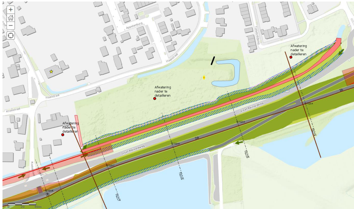
Profiel ter hoogte van dijkpaal TG215

De dijk wordt binnenwaarts versterkt. De bestaande watergang ligt ter hoogte van de nieuwe binnenberm. Daarom moet de watergang worden gedempt. Om een raakvlak met het monument zoveel mogelijk te voorkomen, wordt geen nieuwe watergang gegraven. De pipingmaatregelen moeten nog nader uitgewerkt worden.